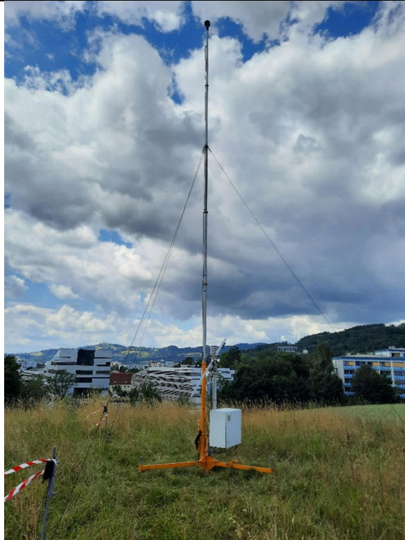
Aufnahmedatum: 02.07.2024 in Richtung West