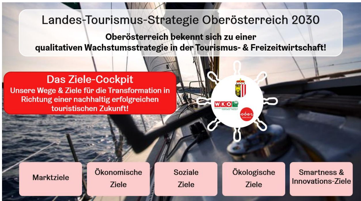
Grafik: OÖ Tourismus